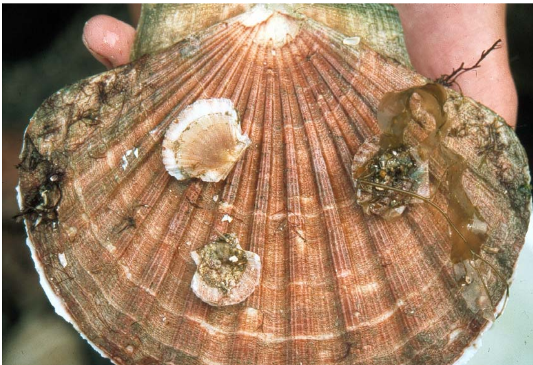
Figur 1. Kamskjell fra Trøndelag. Tre 1 år gamle individer sammenlignet med et 9 år gammelt skjell.

Kamskjellet svømmer ved å lukke skallene med pulserende bevegelser. Vannet blir presset ut på hver side ved skallørene, eller gjennom kappen, slik at svømmeretningen blir enten med ryggsiden først eller sist. Kamskjellet svømmer for å flykte fra rovdyr eller for å velge en plassering på et egnet bunnssubstrat. Svømming er svært energikrevende og derfor en kortvarig aktivitet. Forflyttinger foretas trolig bare over korte avstander, men i litteraturen har det vært diskutert i hvilken grad kamskjell har en retningsbestemt forflytning i forhold til dyp, sesong og reproduksjon. I Norge hevder dykkere at områder som er høstet blir rekolonisert med kamskjell som antas å komme fra større dyp. Skotske undersøkelser viste gjennom merkeforsøk at vel 60% av skjellene ble gjenfanget mindre enn 30 meter fra utsetningspunktet 18 måneder etter utsetting.